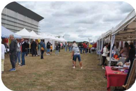
Forum des associations