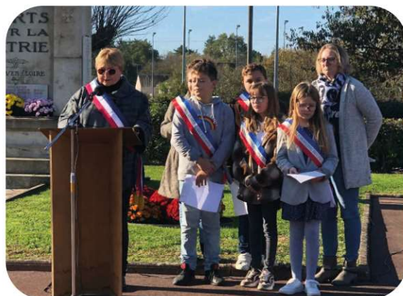
Le CME était présent à l'occasion des cérémonies du 11 Novembre.