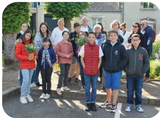
Distribution du muguet aux seniors le 1er Mai 2022 par le CME