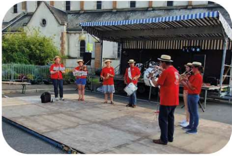
La fête de la musique