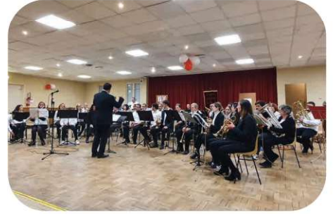
70 ans du Réveil