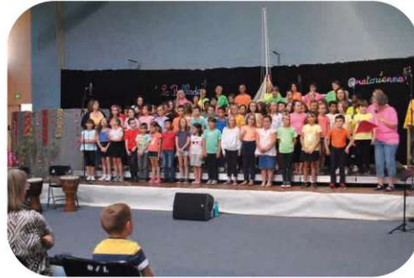
20 ans de la balade oratorienne