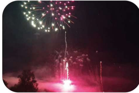
Feu d'artifices du 13 Juillet