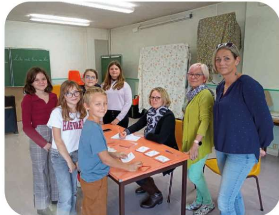
Election du CME