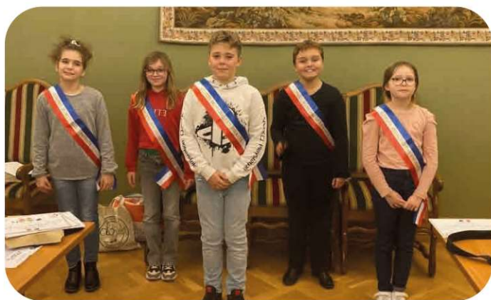
Le maire et ses adjoints