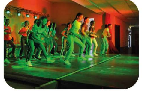
Gala JAY DANCE