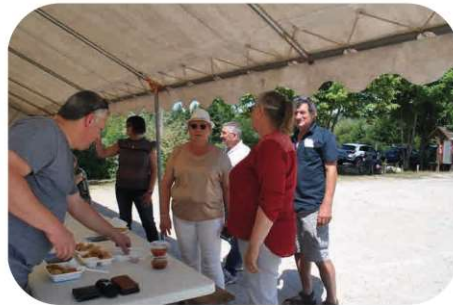
Cuisine du monde