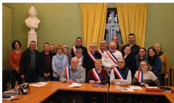
Composition du Conseil Municipal