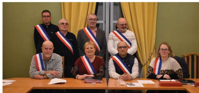
Adjointes et conseillers délégués

Après l'élection du Maire et des Adjointes le vendredi 20 Mars, l'ensemble du nouveau conseil municipal avec les différentes commissions et conseillers délégués a été mis en place le jeudi 26 Mars.